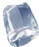
18 gr FULL ICE CUBE