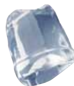
18 gr FULL ICE CUBE