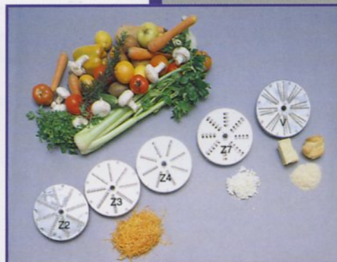
Dischi per sfilacciare Discs for shredding Disques pour effilocheur Metallscheiben zum Ausfasern

Das GEMÜSESCHNITZGERÄT P.S.P. 300 E kann verschiedene Nahrungsmittel in Würfeln oder Scheiben schneiden, raffeln und reiben, wie z. B. Obst, Mandeln, Schokolade usw. Das Gerät ist mit den herkömmlichsten technischen Erneuerungen versehen, bei aller Achtung der EWG-Sicherheitsnormen. In dieser Hinsicht ist das Gerät mit einem doppelten elektromagnetischen Kontakt versehen, der das Gerät nur dann anlässt, wenn der Druckhebel sich in Arbeitsstellung befindet. Mit dreiphasiger Motorisierung 220/380 Volt versehen, oder auf Anfrage in einphasiger Ausführung 220 Volt. Die Steuerungsanlage arbeitet mit 24 Volt und ist mit Streiftaster versehen. Gerät und Einsätze sind aus rostfreiem Stahl. Die Einsätze (Messer, Scheiben mm. 190) sind entsprechend gehärtet, um einen dauerhaften Betrieb zu gewährleisten. Diese Einsätze sind mit Renkverschluss versehen, um ihre Montage auf der Antriebswelle zu erleichtern.