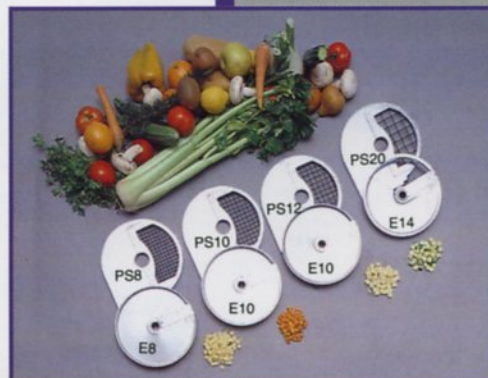
Dischi per cubettare Discs for dicing Disques pour couper en cubes Metallscheiben zum Würfeln