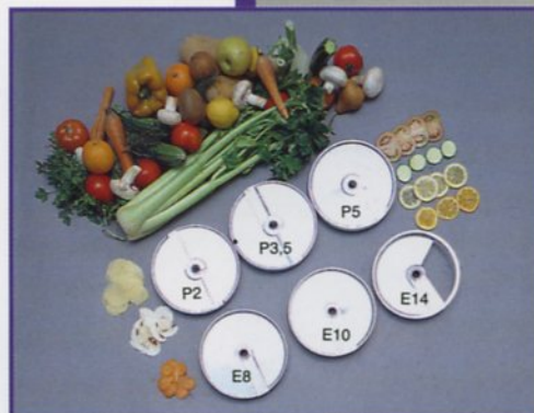
Dischi per affettare Discs for slicing Disques pour couper en tranches Metallscheiben zum Schneiden in slicing