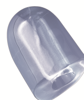
17 gr HOLLOW ICE CUBE