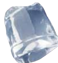
18 gr FULL ICE CUBE